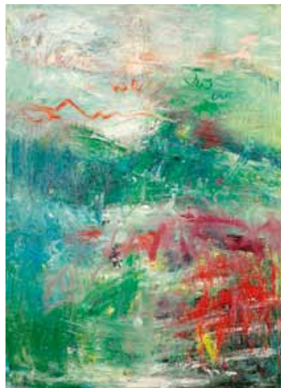
INGRID OBENDIEK: leer weg ach wo , 2002, 200 x 145 cm, Öl auf Baumwolle

die Entwicklung des Bildes mit der Akteurin spielen dabei eine bedeutende Rolle. HEINZ MACK nannte diesen Prozess seismografisch innerhalb seiner Zeichnungen, ähnlich verhält es sich bei OBENDIEK. Voller Spannung gestaltet sich das Ende