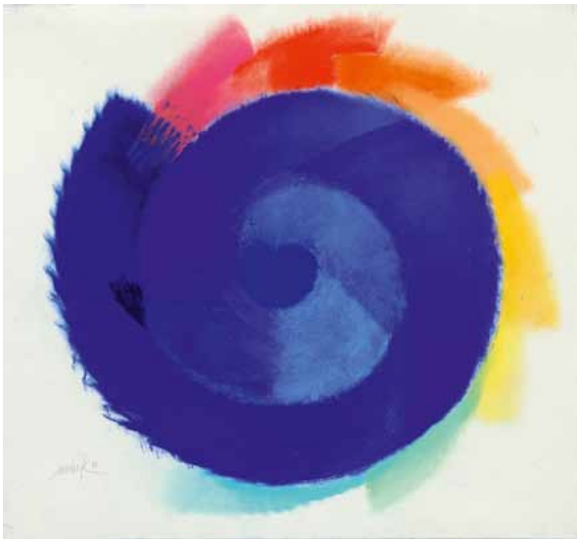
HEINZ MACK, Ohne Titel , 1999, Pastellkreide auf Büttchen, 85 x 86 cm, © VG Bild-Kunst, Bonn 2011

lichen Betrachtung von Licht. Durch Zufall entdeckt er für sich die Frottage, das Abreiben von Gegenständen auf Papier. Wellbleche, Aluminiumstücke, Gitter, Raster aus festem Material versinnbildlichen für MACK die Struktur, die Anordnung, Teile eines Ganzen, die er schon Jahre zuvor durch das Objektiv fokussiert hatte. Er beginnt, die Regenbogenfarben mit feinen behutsamen Abstufungen aneinander zu setzen. Es entstehen monochrome Flächen auf lang fallenden Papieren. Oft sind die abgeriebenen Linien vertikal und geben der Farbe eine Schwingung, eine Vibration, wie MACK gern sagt. „Die Frottage ist nichts anderes als ein technisches Mittel, um die halluzinatorischen Fähigkeiten des Geistes zu steigern“, erläutert MAX ERNST, Vater der Abriebtechnik im Jahr 1935. Sieht MACK dies ähnlich? Erst 1991 beginnt er wieder mit Pinsel auf Leinwand zu malen. Mit der Gründung der ZERO-Bewegung, in nicht mehr als fünf Jahren, gelingt es MACK mit seinen Kollegen OTTO PIENE und GÜNTHER UECKER in-