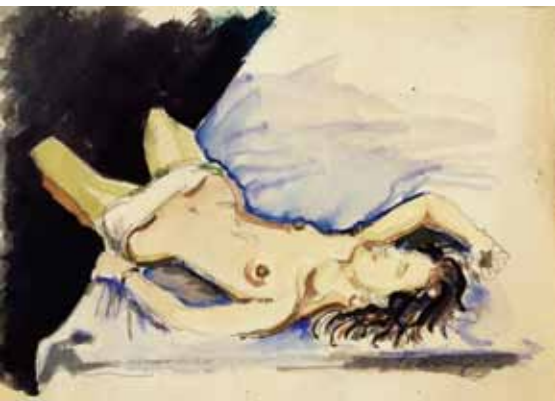
NORBERT TADEUSZ: Ohne Titel , 1969, Aquarell und Bleistift auf Papier 14.7 x 21 cm

NORBERT TADEUSZ ist einer der produktivsten und eigenwilligsten Maler der deutschen Gegenwart mit einem komplexen Œuvre an Papierarbeiten. Aus diesem zeigt Schönwald Fine Arts in Kooperation mit FRED JAHN 68 Aquarelle und Zeichnungen von 1960 bis 1969. Im Vordergrund steht dabei sein anhaltendes, jedoch für dieses Zeitintervall anachronistisches Grundthema, die