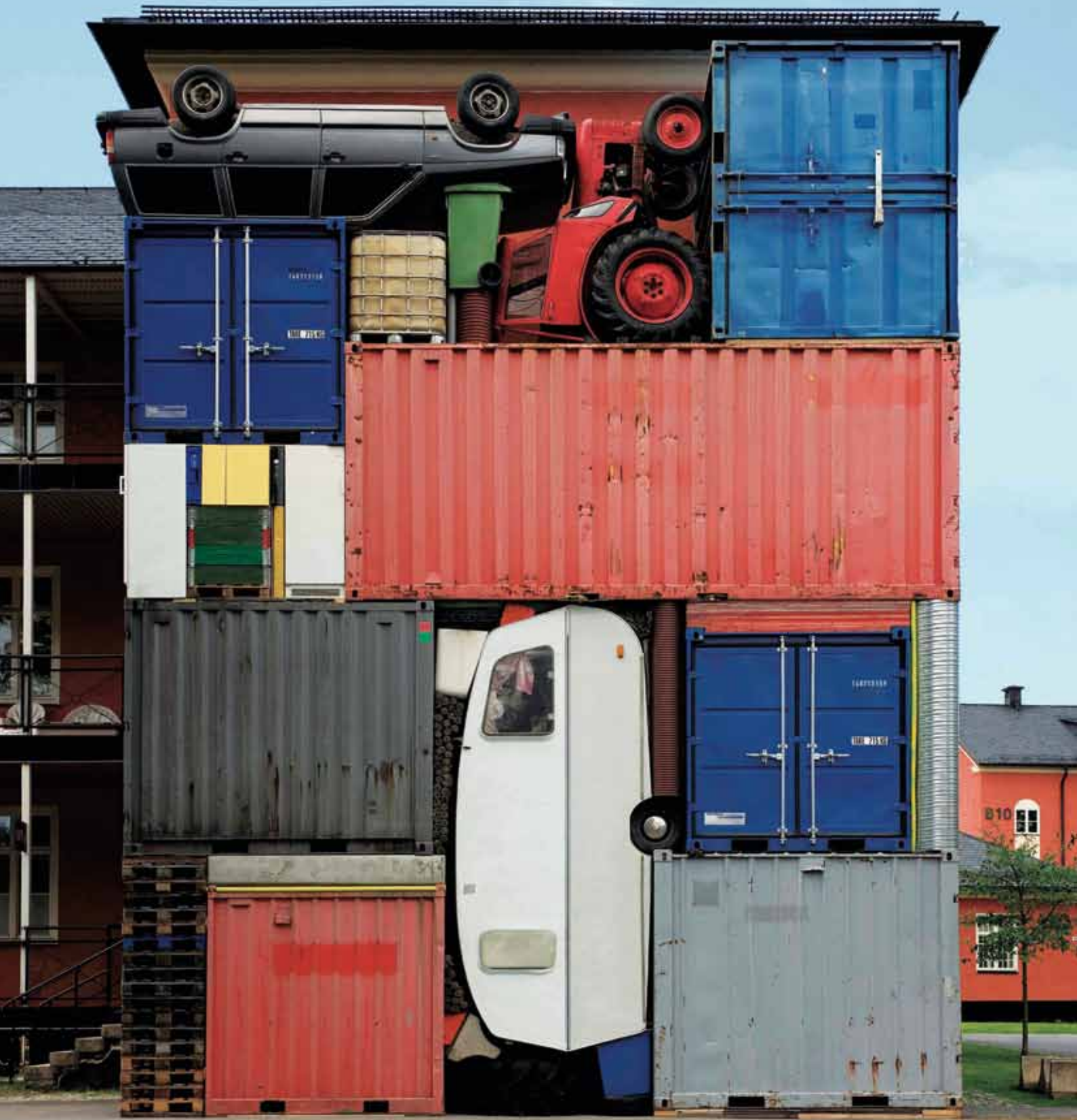
Ab 8. Juni im NRW-Forum: Container-Architektur! MICHAEL JOHANSSON, self contained , 2010, eine Skulptur aus Containern und Fahrzeugen in Schweden, Foto: Katalog NRW-Forum Düsseldorf