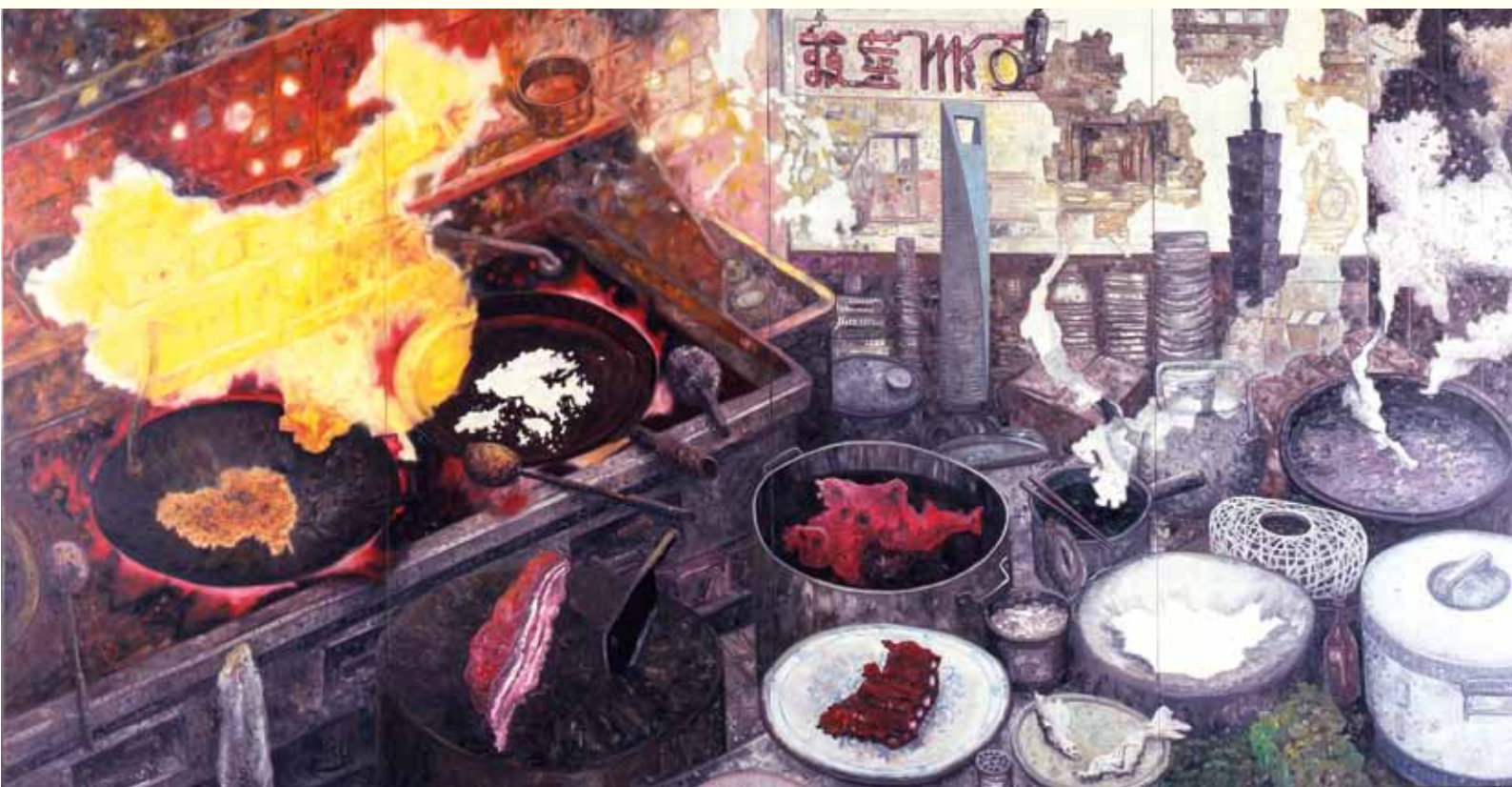
Kunsthalle Düsseldorf: OSCAR OIWA, Asian Kitchen , 2008, Oil on canvas, 227 x 444 cm, Courtesy: BTAP + Tokyo Gallery, Tokyo