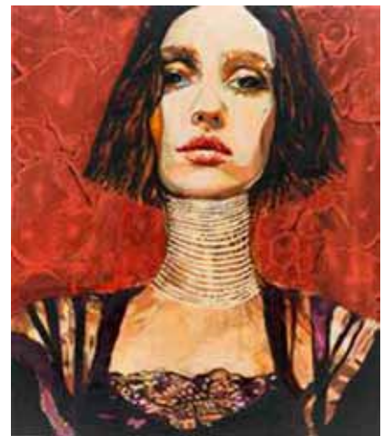
CORNELIA SCHLEIME: Femme Fatale , 2010, Acryl, Asphaltlack und Schellack auf Leinwand, 210 x 180 cm