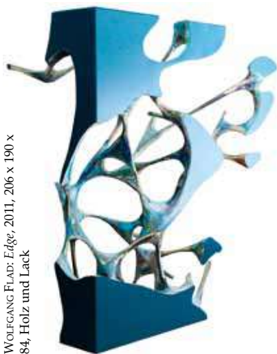
WOLFGANG FLAD: Edge , 2011, 206 x 190 x 84, Holz und Lack

Die Galerie Clara Maria Sels zeigt Wandarbeiten und Skulpturen des Berliners WOLFGANG FLAD . Er verwendet in seinen Arbeiten Holz als Untergrund, das er mit einer glänzenden, monochromen Lackschicht überzieht. In die glatte Fläche wer-