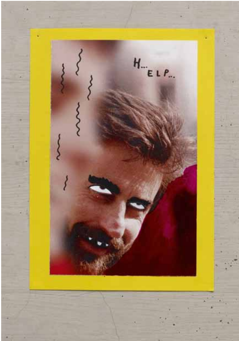
DENNIS TYFUS, eine von neun Arbeiten auf Papier, Mixed Media, 29,7 x 21 cm