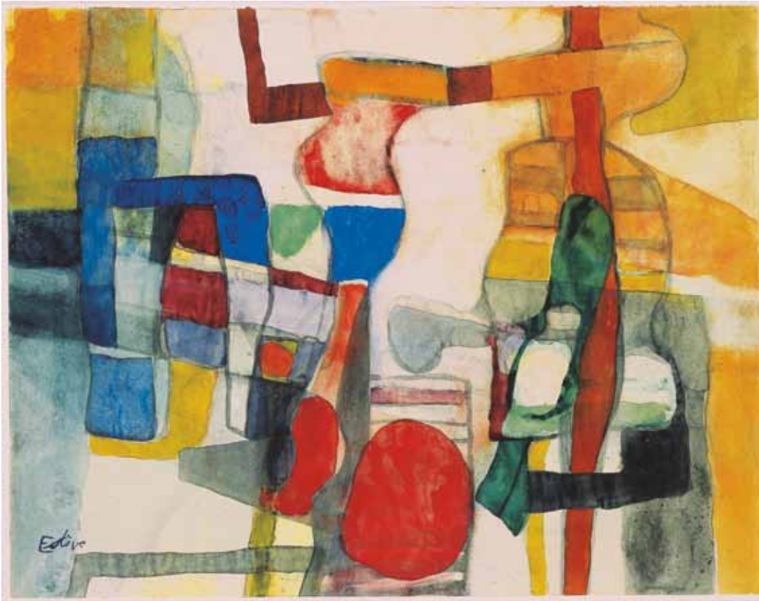
MAURICE ESTÈVE: Ohne Titel , 1954, Aquarell auf Papier, 43 x 55 cm, links unten signiert, courtesy MADAME BOURDON, Paris

gewählten Blickwinkel. Er verzichtet konsequent auf Symmetrien, Fronten, rechte Winkel oder andere ordnende Maßnahmen, die zu sehenden murals werden stets als ein integraler und organischer Bestandteil des Stadtbildes gezeigt.