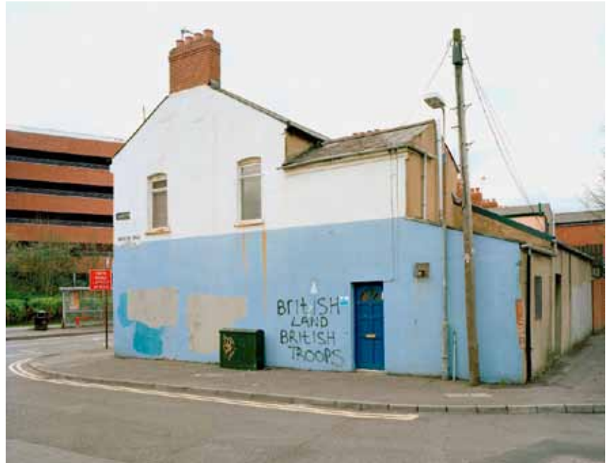
Foto: CHRIS DURHAM, British Land British Troops , 70 x 90 gerahmt, C-print

Was seine bisherigen Arbeiten eint ist ihr dokumentarischer Charakter,