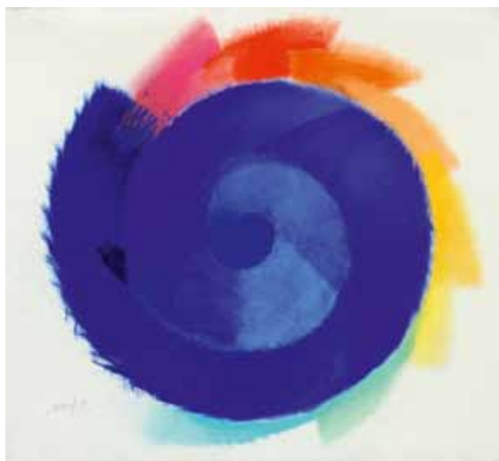
HEINZ MACK, Ohne Titel , 1999, Pastellkreide auf Bütten, 85 x 86 cm, © VG Bild-Kunst, Bonn 2011

Einer der großartigsten Künstler unserer Zeit: HEINZ MACK. Anlässlich seines achtzigsten Geburtstags und der Ausstellung im museum kunst palast lesen Sie eine Hommage von FRIDA LAU ab Seite 8.