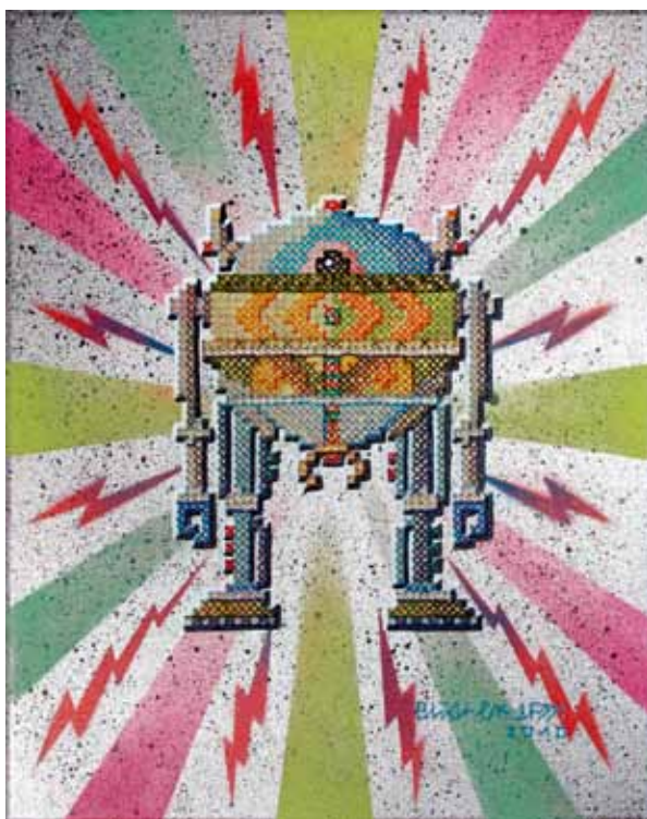
ELIOT: X Stitch Robot I , 2010, 50 x 60 cm, Sprühlack und Garn auf Leinwand

ELIOT malt Gebrauchsgegenstände seiner Graffiti-Vergangenheit wie Marker, Farbroller oder Sprühdosen und gibt ihnen mittels eines aufgestickten Pixelrasters eine überras-