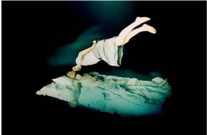
LIEKO SHIGA: Chiako , 2007, C-print

Im Jahr der 150jährigen deutsch-japanischen Freundschaft lädt der Kunstraum Düsseldorf vier japanische und fünf europäische Künstlerinnen und Künstler ein, ihre unterschiedlichen Sichtweisen auf Fotografie gegenüberzustellen. Die Bandbreite der Ausstellung reicht von Video- und Dia-Installationen über serielle Arbeiten und tagebuchartige Fotografien, von