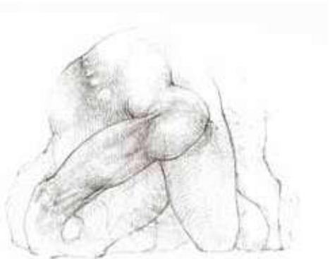
ATHAR JABER: o.T., 2009, Pigmenttinte auf Papier, 24 x 32 cm, ©Galerie arteversum, Düsseldorf

In der Galerie arteversum startete am 16. April die erste Ausstellung einer internationalen Galerie-Kooperation from different corners . Dabei ist der Titel in doppelter Hinsicht Programm, denn die Schau vereint Papierarbeiten aus verschiedenen