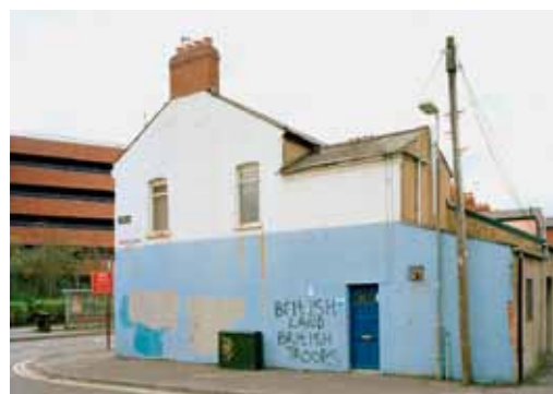
Foto: CHRIS DURHAM, British Land British Troops , 70 x 90 gerahmt, C-print

Auch in diesen Wochen bietet die großartige Kunstszene Düsseldorfs wieder zahlreiche Highlights. Informationen, Meinungen und unsere Übersicht finden Sie ab Seite 12.