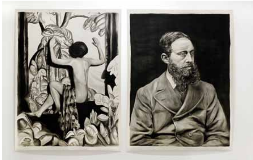
RINUS VAN DE VELDE, A Tryptic of Questions , 2011, Kohle auf Papier, 270 x 200 cm

dieser als offenkundige Botschaft auftritt, wird er moralisch, harmlos und schlichtweg langweilig.“ Leider ist das andere Extrem auch langweilig, weil die Botschaft entweder nicht verständlich ist oder es gar keine gibt.